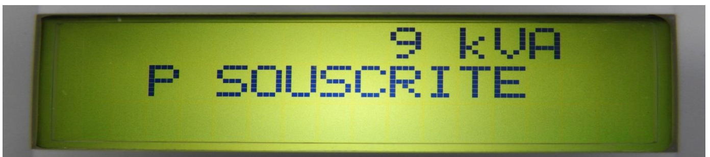
Affichage : 9 kVA PUISSANCE SOUSCRITE

Si vous possédez un système de comptage connecté Linky, le disjoncteur qui maintenant a un pouvoir de coupure et de ré-enclenchement à distance est intégré dans le compteur Linky, c'est lui qui sert de calibre en fonction de votre contrat d'abonnement qui avec le Linky est non pas en ampères comme précédemment, mais directement en kVA , en conséquence, voici l'affichage du Linky :