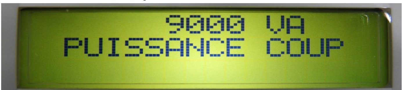
Affichage : 9000 VA soit 9 kVA PUISSANCE COUP = PUISSANCE COUPURE NETTE DISJONCTEUR INTÉGRÉ AU LINKY